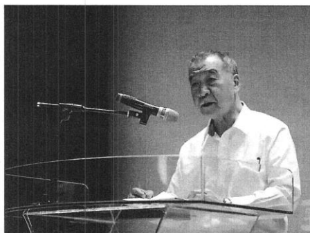
國防部長邱國正日前主持「國軍111年部隊工作策進會議」。