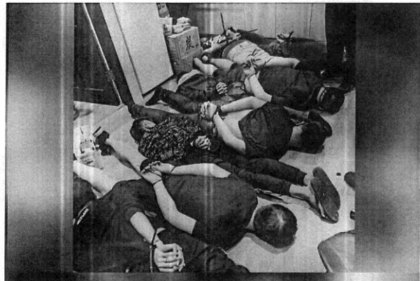
台版柬埔寨求職詐騙案，案中警式囚禁58人，還鬧出3條人命，詐騙集團手段凶殘，被害人一進屋就被搜身抽財、嘴塞毛巾，上手銜、腳綁束帶，丟進5坪大房間，如果交談就被毒打凌虐，還嚴毒品FM2控制行動。記者王長儀／翻攝